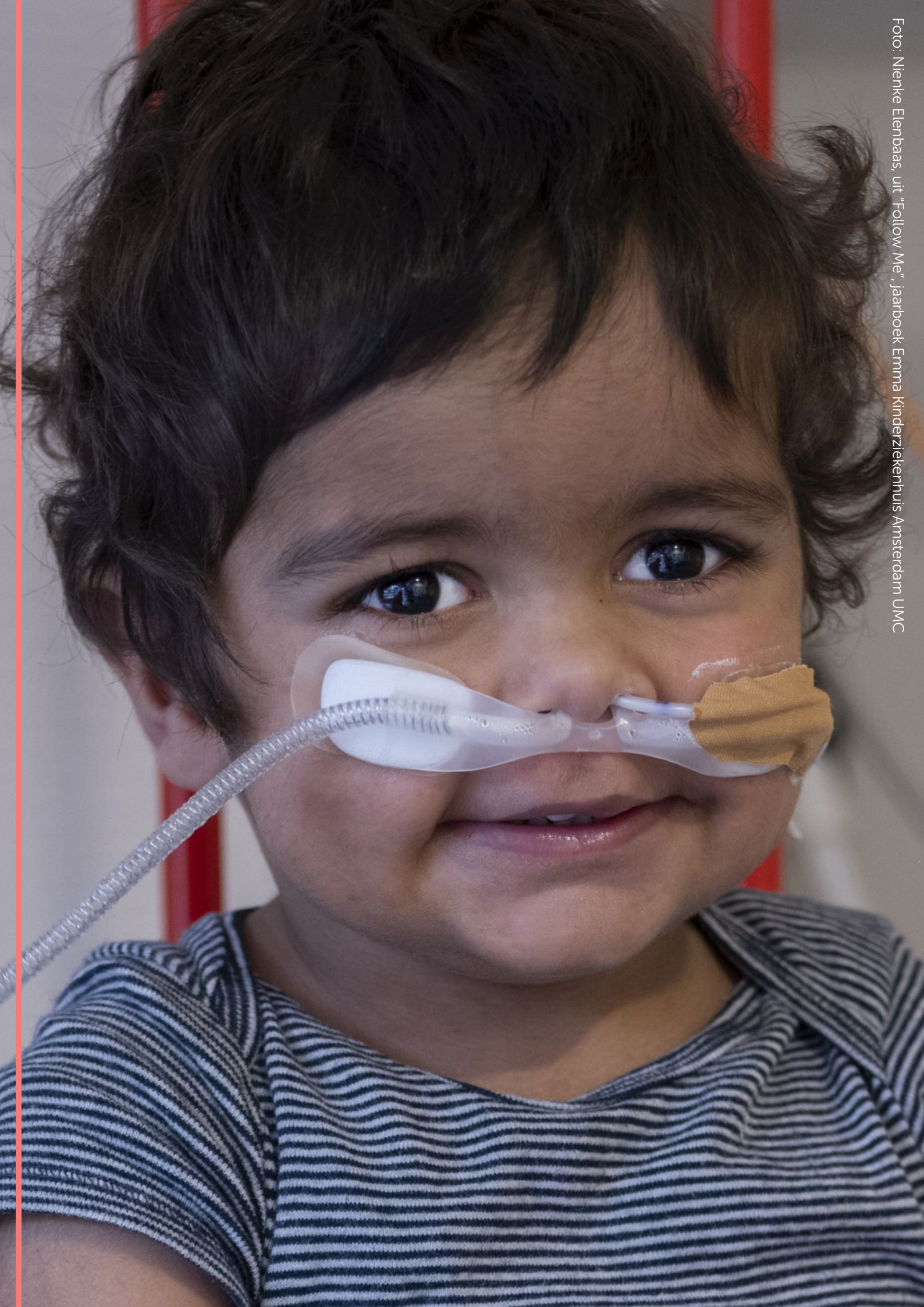
Foto: Nienke Elenbaas, uit "Follow Me", jaarboek Emma Kinderziekenhuis Amsterdam UMC